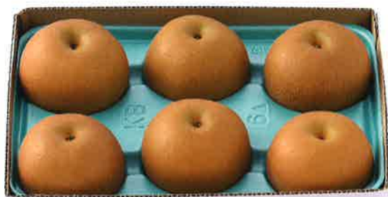
3kg 5L (6玉入り)