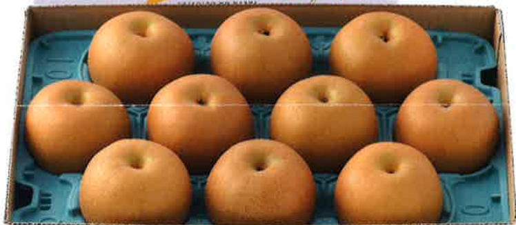
5kg 5L (9~10玉入り)